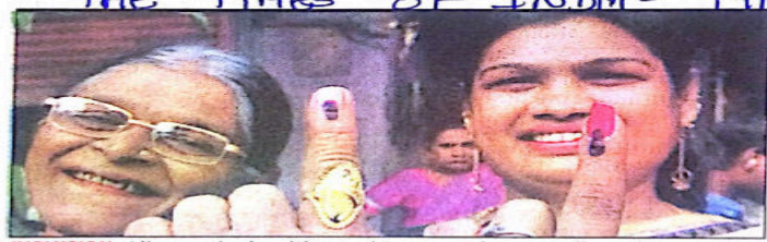
INCLUSION: All sexual minorities and transgenders are allowed to register as Others in the voters' list. But very few have registered

Mysuru: The Election Commission and all district administrations have organised awareness initiatives to register transgender in the voters' list and ensure they also exercise their franchise. They are categorised as Others in the list. According to the final list for 2018, 4,552 transgenders have registered. This excludes new additions following Minchina Nondani which concluded on April 14. According to activists, since 2013, all sexual minorities and transgenders are allowed to register as Others in the voters' list. But despite awareness drives by various government and non-governmental organisations, very few have registered. As per the voters' list in